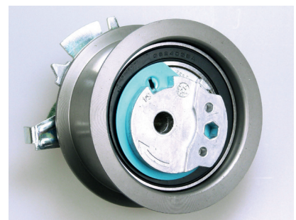
Figure 1 Ancien modèle de galet

Le galet tendeur fourni V56340 diffère par son aspect de celui monté sur le véhicule, et semble ne pas pouvoir être tendu correctement.